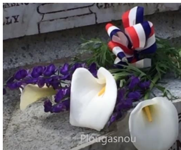
Fleurs du jardin à Plougasnou

Plougasnou, ville de notre siège social devait être en 2020, pour cet hommage national, le théâtre d'une très grande et forte cérémonie.