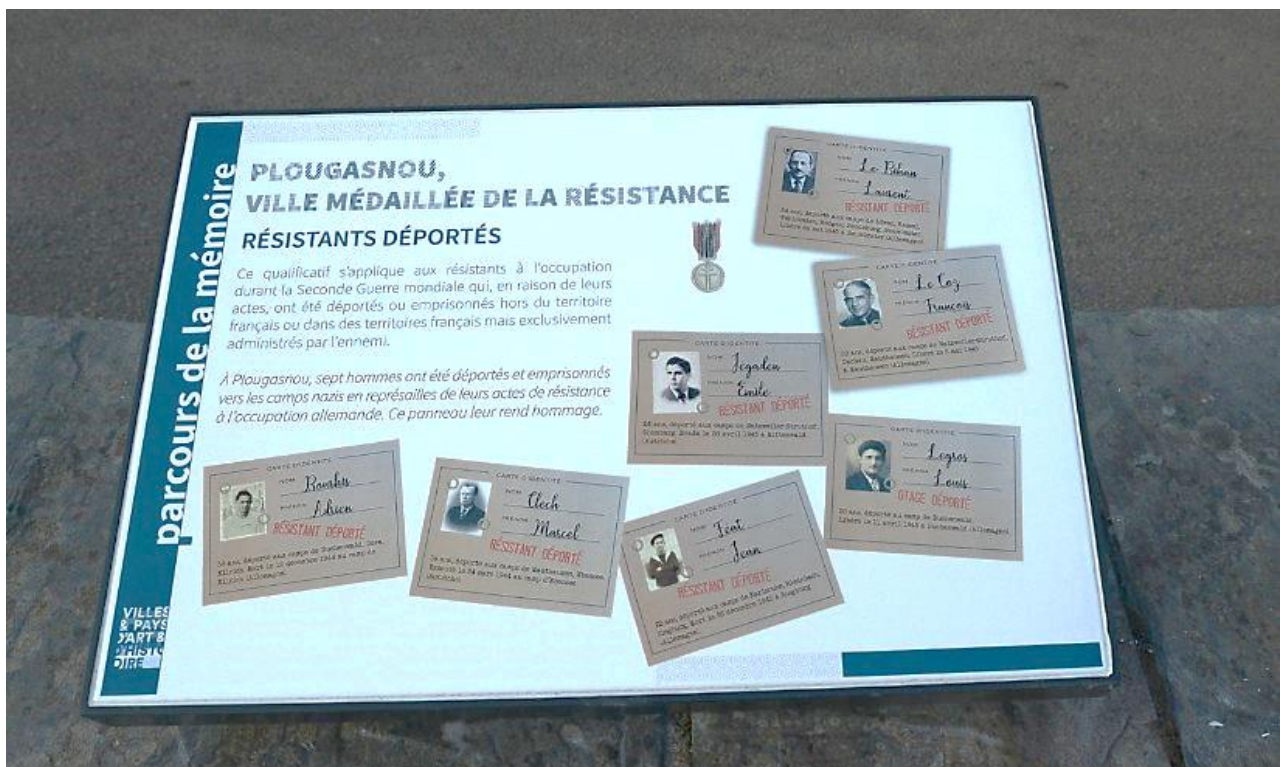
Panneau à la Mémoire des Déportés