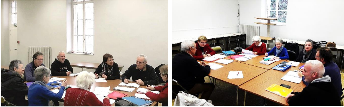
Le conseil d'administration de la Délégation du Finistère en réunion de travail

Les Amis de la Fondation pour la Mémoire de la Déportation du Finistère travaillent pour assurer la pérennité, l'enrichissement et la transmission de la Déportation et de l'Internement dans le respect plein et entier des buts de la Fondation pour la Mémoire de la Déportation (FMD).