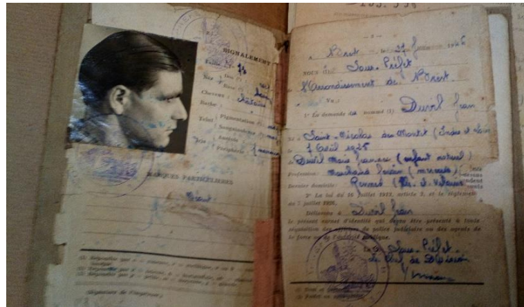
Extrait d'un carnet anthropométrique