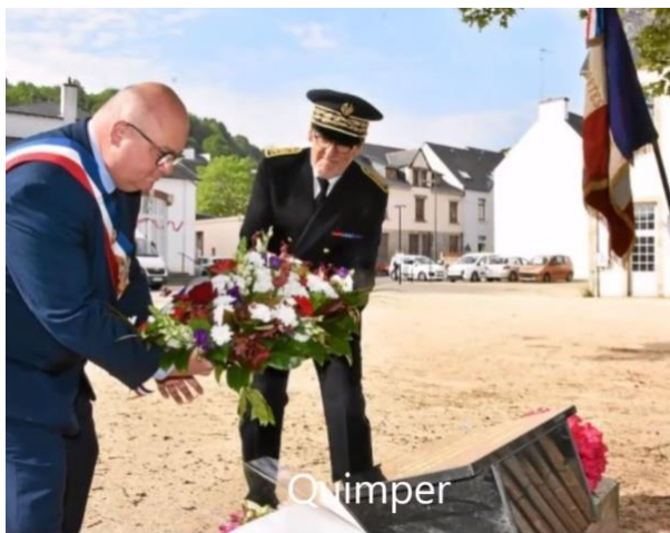
Dépôt de la gerbe par le maire de Quimper

Les cérémonies ont toutes été annulées. Les villes de Morlaix et de Quimper ont organisé une cérémonie en tout petit comité. Pour les autres lieux, là où se trouvaient des membres de l'AFMD-DT29, des bouquets de fleurs des champs ou des jardins ont été déposés.