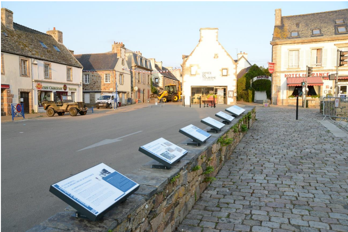
Chemin de la Mémoire sur la place de l'église de Plougasnou