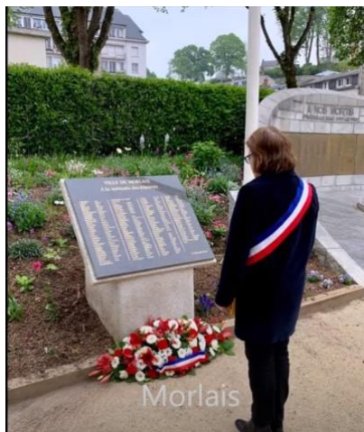
Dépôt de la gerbe par le maire de Morlaix