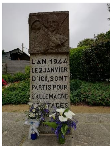
Fleurs des jardins et fleurs des champs pour la stèle des Otages morlaisiens